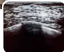
サンプル画像(正常乳房)

乳房に超音波をあて、内部からの反射波(エコー)を画像にして、異常がないかを診断します。放射線を使わないので、妊娠している方にも安心です。